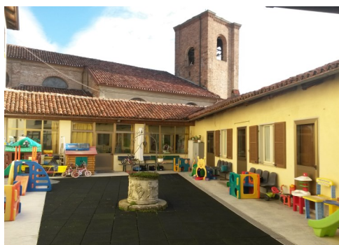
Sono presenti una sezione primavera (per bambini da

La scuola dispone di un comodo cortile interno , ad uso esclusivo: per conformazione e posizione, permette ai bambini di godere di momenti di svago all’aperto anche nei mesi invernali.